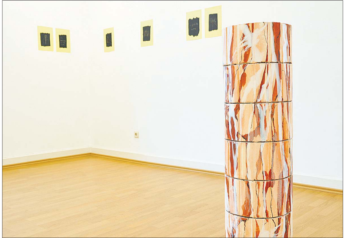
Un art à la frontière entre le décoratif et le conceptuel.