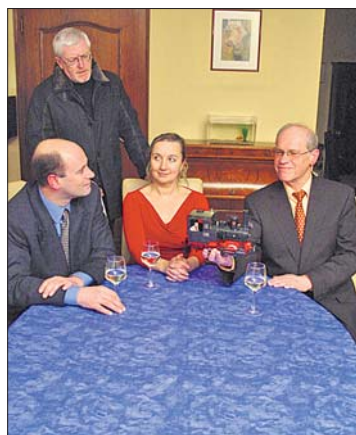
Première vun „Mir kréie Besuch“ ass den 23. Abrëll.

Kaméidistéck „Mir kréie Besuch“ vun Den Theater.lu